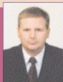
Заступник Голови Комісії Вадим Валентинович ЛИТВИН

В. В. Литвин народився 13 вересня 1963 р. Має вищу освіту – технічну та економічну, навчається на 5-му курсі Національної юридичної академії України ім. Я. Мудрого. Був обраний народним депутатом України до Верховної Ради України II та IV скликань. Брав активну участь у розробленні 13 законопроектів, зокрема «Про рентні платежі на нафту і природний газ», «Про порядок погашення заборгованості за електричну енергію», «Про внесення змін до статті 11 Закону України «Про податок на додану вартість» (щодо поширення касового способу нарахування податку в паливно-енергетичному комплексі) та ін. В. В. Литвин – секретар Комітету Верховної Ради України з питань паливно-енергетичного комплексу, ядерної політики та ядерної безпеки.